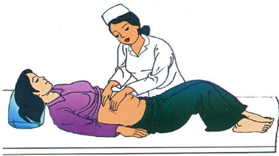
Khám thai định kỳ