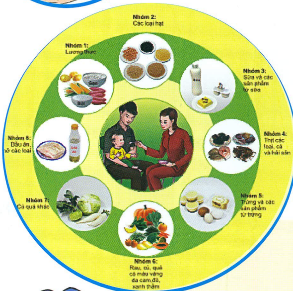
Cho trẻ ăn bổ sung đầy đủ các nhóm thực phẩm

Bú mẹ hoàn toàn trong 6 tháng đầu, bắt đầu cho trẻ ăn bổ sung từ khi tròn 6 tháng và tiếp tục cho bú đến 24 tháng hoặc lâu hơn