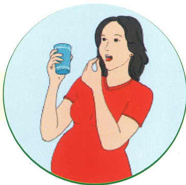
Uống viên đa vi chất hàng ngày