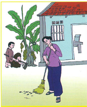
Lao động nghỉ ngơi hợp lý