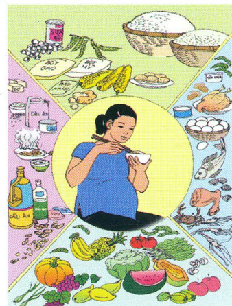
Ăn uống đầy đủ các chất dinh dưỡng